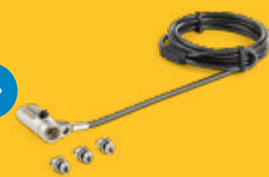
Laptop-Kabelschloss K-Slot/ Nano/Wedge LTULOCK4D