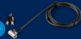
Laptop-Kabelschloss K-Slot/ Nano/Wedge - Mit Schlüssel LTULOCKKEY